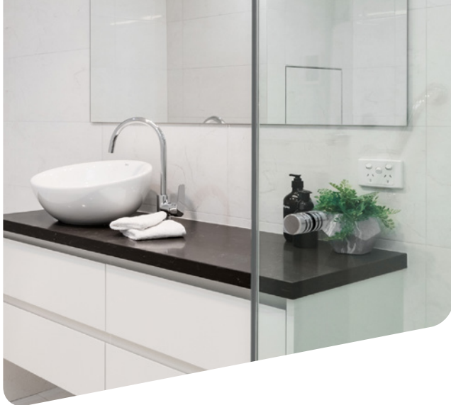
TIMELESS® na szkłe odżelazionym DIAMANT®, wyraźnie jaśniejsza krawędź szkła