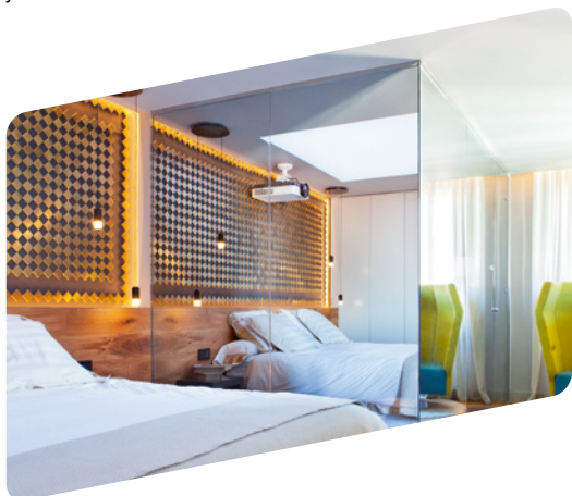
▲ Światło o większym natężeniu w sypialni. Prawie zupełny brak światła w łazience.

MIRASTAR® pozwala uzyskać niesamowity efekt: w zależności od warunków oświetleniowych szkło może odbijać światło lub być przezroczyste. Ta podwójna funkcjonalność pozwala na kreowanie unikalnych projektów. MIRASTAR® może zachowywać się zupełnie jak lustro lub przepuszczać światło jak szkło przezroczyste. Ta właściwość pozwala na przysłonięcie lub odsłonięcie pomieszczenia na życzenie. Szkło MIRASTAR® jest czasem używane jako lustro weneckie.