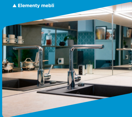
▲ Kuchenne panele ściennie typu splashback