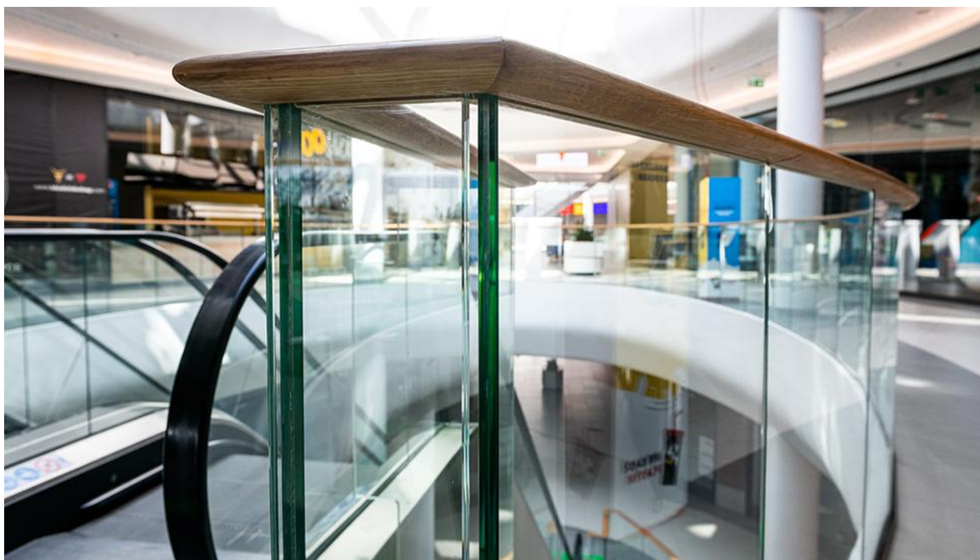
1_Kompleks Solaris Center