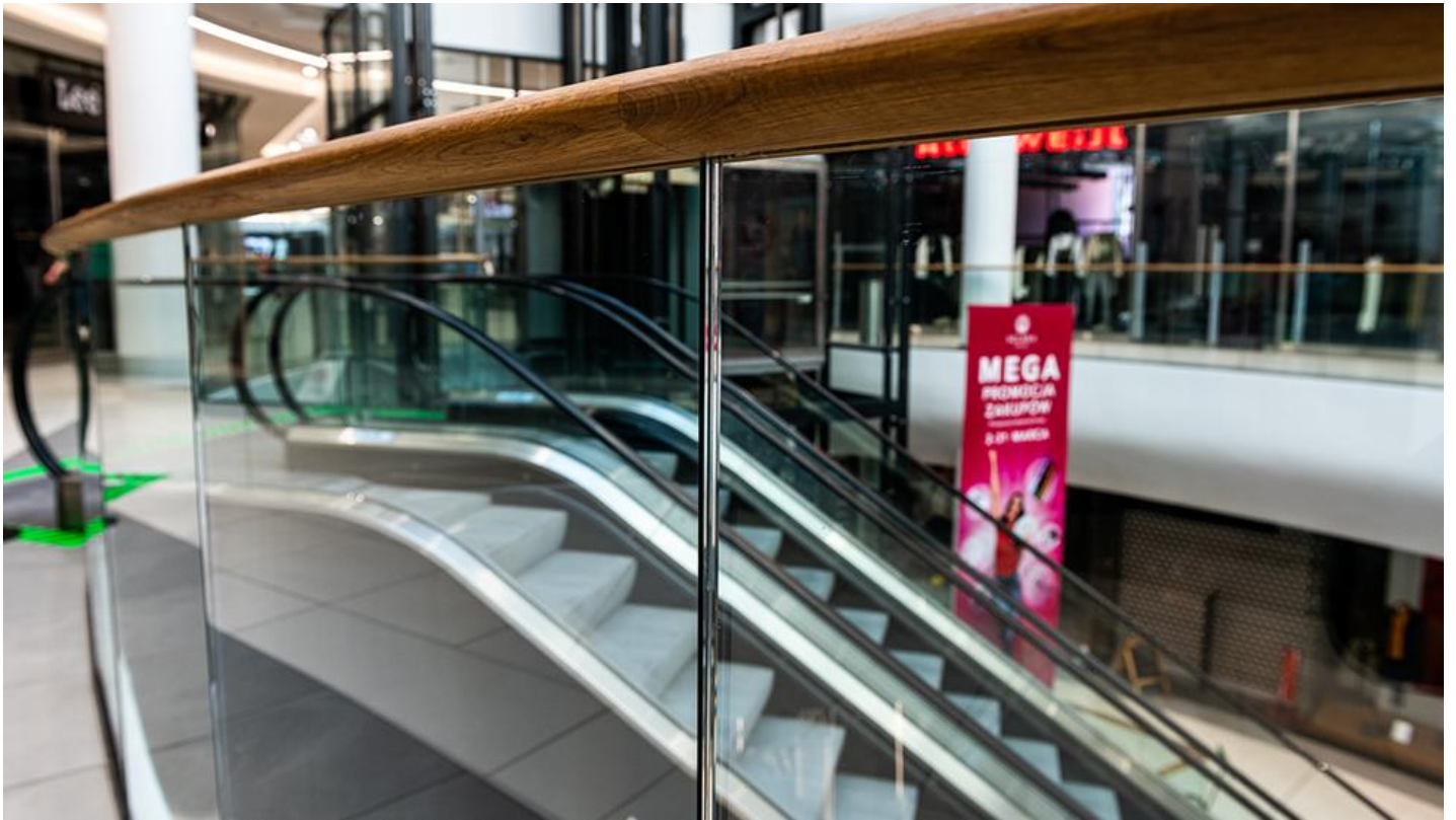
6_Kompleks Solaris Center