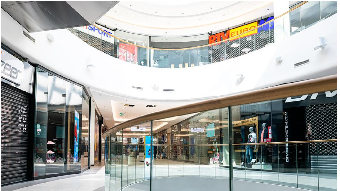
7_Kompleks Solaris Center