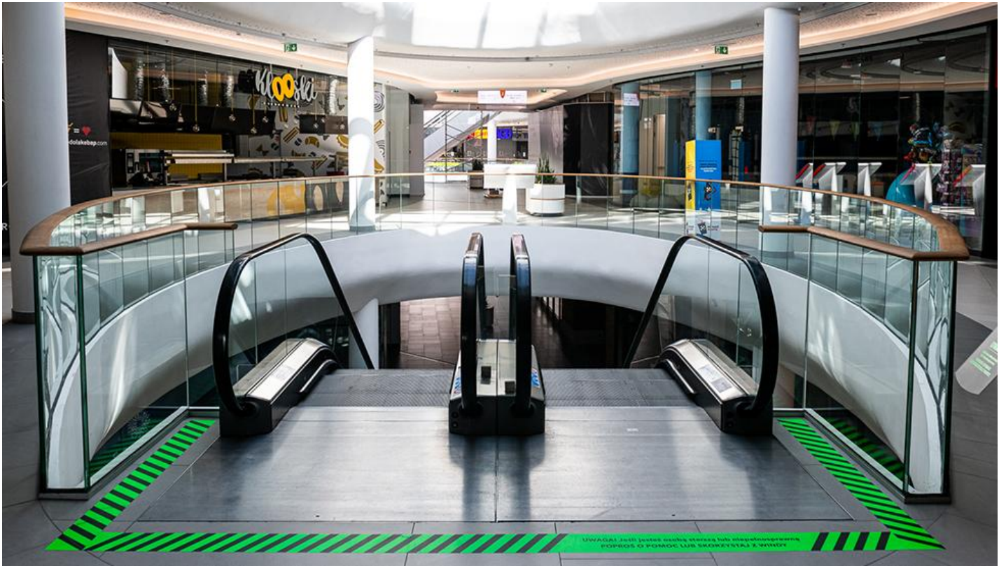
2_Kompleks Solaris Center