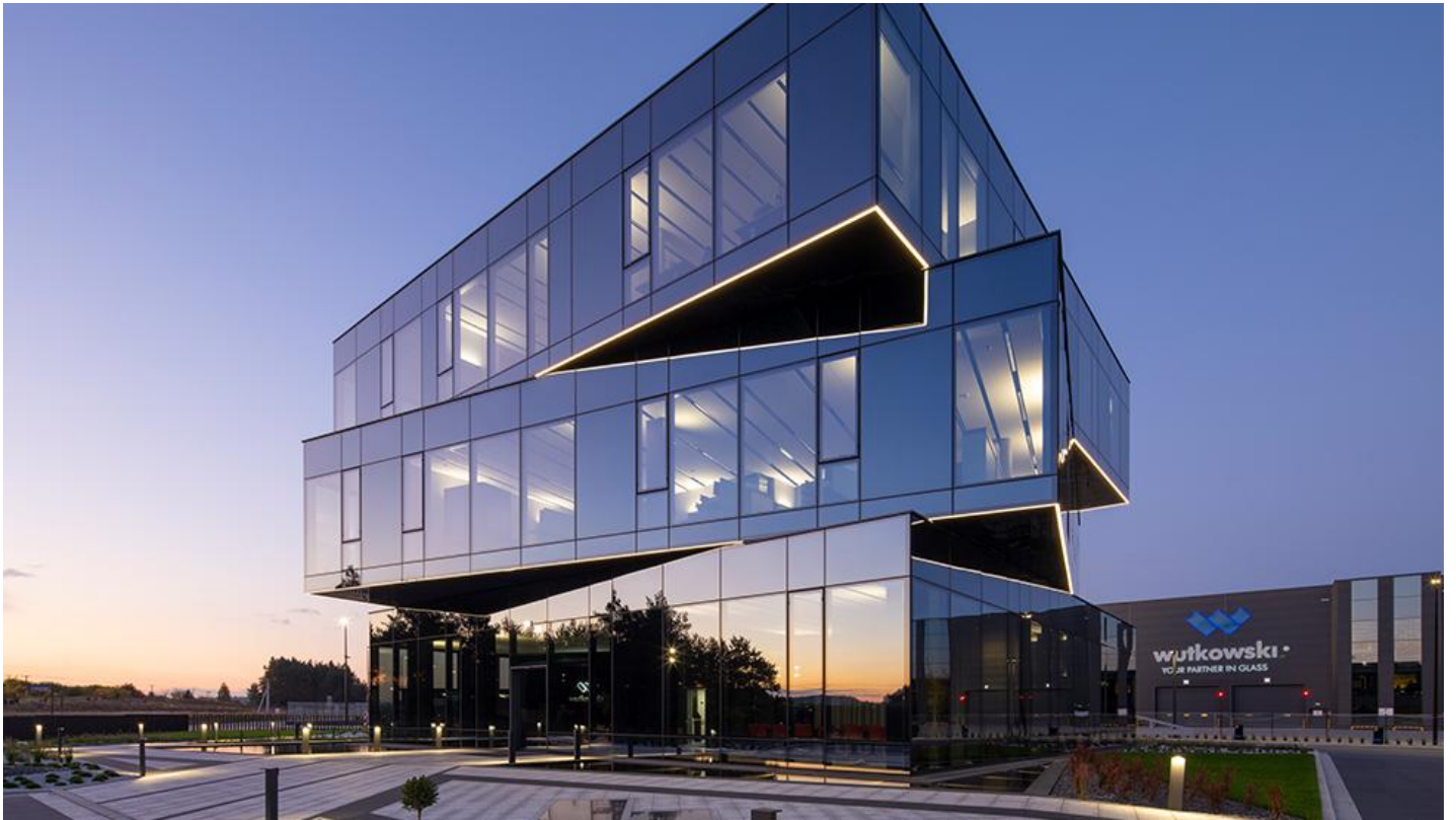
5_Nowa siedziba firmy Wutkowski