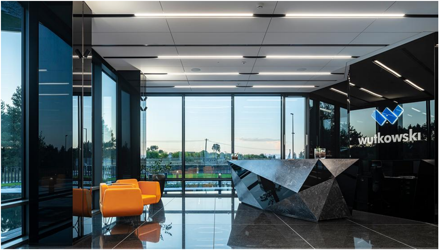
4_Nowa siedziba firmy Wutkowski