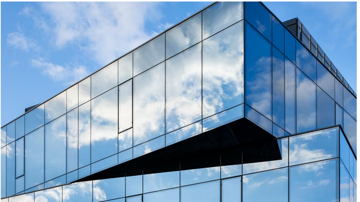
3_Nowa siedziba firmy Wutkowski