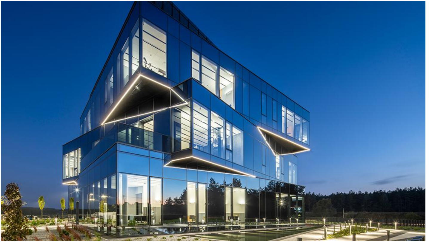
6_Nowa siedziba firmy Wutkowski